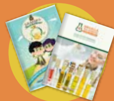
Guía ilustrada para primarios y secundarios